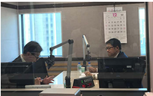
【ラジオ NIKKEI 番組収録中の様子】